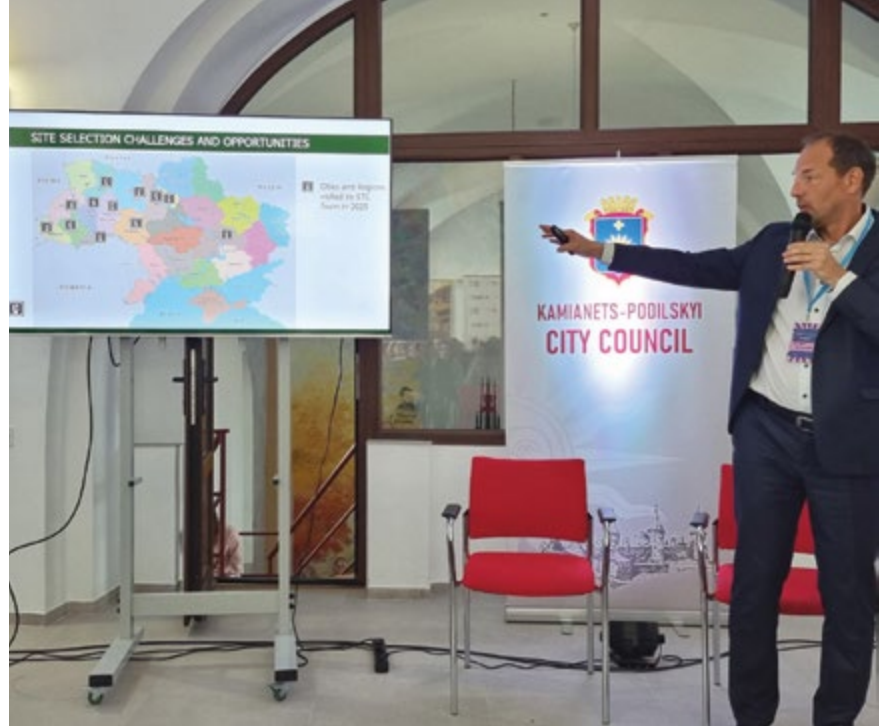
↑ Präsentation konkreter Kooperationsansätze für Investitionsprojekte in mehreren Regionen der Ukraine im Rahmen eines regionalen Investmentforums.

institutionelle Einbettung und schrittweise Umsetzung miteinander verbindet.